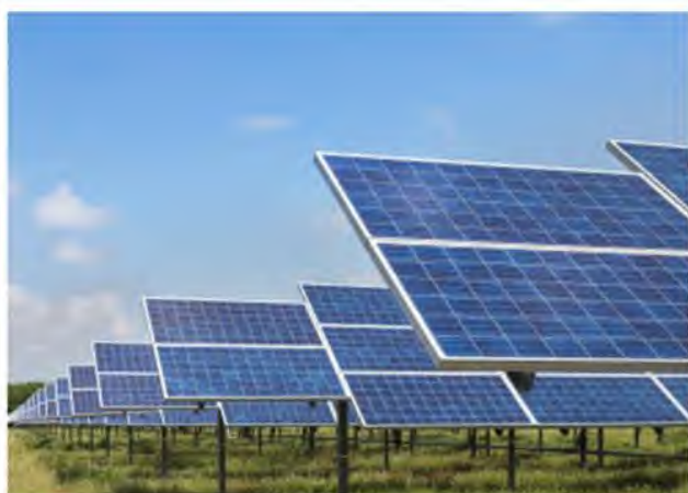
应用场景：光伏发电

新能源变压器主要应用于光伏发电等领域，产品主要包括：配套于光伏逆变器的高频磁性器件、应用于光伏发电电网的升压变压器以及其他电能转换产品。高频磁性器件是光伏逆变器设备储能和能源转换的核心元器件，公司产品具有噪音小，稳定性高等特点，已连续几年为国内知名主流光伏逆变器厂商大批量供应。光伏升压变压器是光伏电站中升压并网的关键器件，公司产品具有转换效率高，稳定性好，恶劣环境适应力强等特点，广泛应用于国内外众多光伏电站。凭借过硬的技术实力、产品质量和规模化的生产能力，公司也是国内较早打入美国、日本、欧盟等主要光伏市场的厂商。